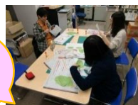
募集ポスター作り