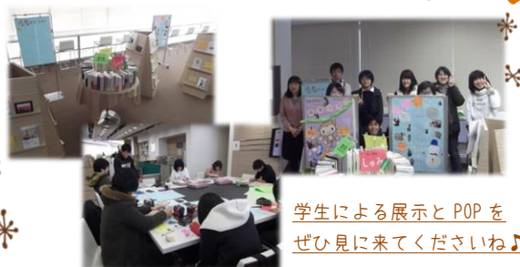
学生による展示とPOPをぜひ見に来てくださいね♪